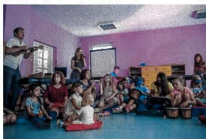
Letni Obóz Muzyczny w Serocku, sierpień 2017 r.