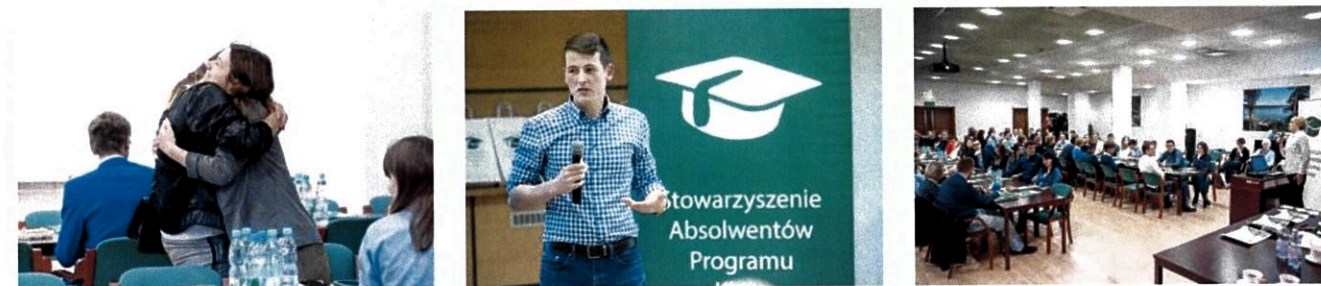
Walne Zebranie Członków Stowarzyszenia Absolwentów Programu Klasa, wrzesień 2017 r.