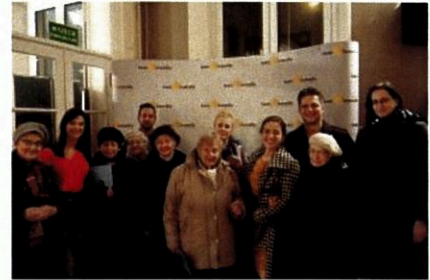
Projekty wolontariackie pracowników Banku, 2017

Fundacja BGŻ BNP Paribas odpowiada również za organizację corocznych akcji społecznych angażujących pracowników Banku BGŻ BNP Paribas: