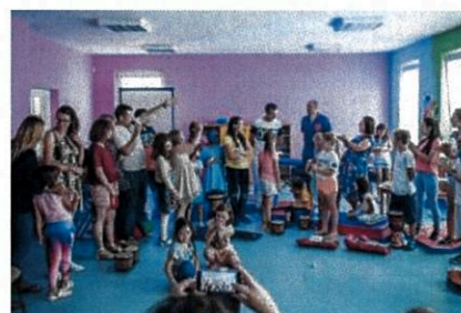
Letni Obóz Muzyczny w Serocku, sierpień 2017 r.

Program obejmuje 3-letnie działania z zakresu edukacji muzycznej i muzykowania zespołowego w świetlicach środowiskowych, w tym regularną grę na instrumentach blisko 50 najbardziej zainteresowanych i zmotywowanych uczestników. Poprzez aktywność muzyczną połączoną z pracą wychowawczą, dzieci uczą się wzajemnego szacunku, rozwijają swoją kreatywność i kompetencje kulturowe, wzbogacają osobowość i budują harmonię emocjonalną.