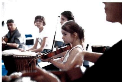
Warsztat podsumowujący, czerwiec 2017 r.