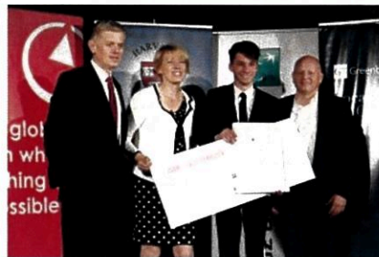
Gala finałowa konkursu Droga na Harvard, czerwiec 2017 r.

Więcej informacji: www.droganaharvard.pl