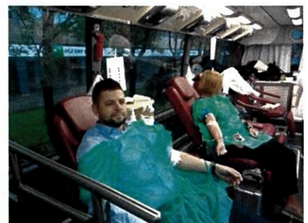
Akcja Krwinka w Banku, październik 2017