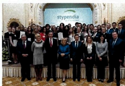
Gala programu Stypendia Pomostowe, listopad 2017 r.

Program skonstruowany został w taki sposób, aby zachęcać i motywować do dalszej edukacji najzdolniejszych uczniów planujących działać na rzecz rozwoju obszarów wiejskich. Pierwszy etap (stypendium dla laureatów OWiUR) ma charakter nagradzający i motywacyjny. Wielu stypendystów wyłonionych na tym etapie, po zakończeniu szkoły średniej decyduje się na kontynuację nauki na specjalistycznych uczelniach wyższych, gdzie również może liczyć na wsparcie Fundacji w ramach programu Stypendia Pomostowe.