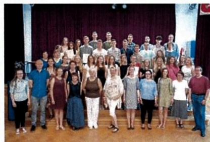
Integracyjny obóz językowy dla stypendystów, lipiec 2017 r.