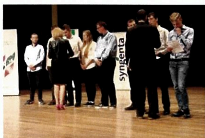
Gala finałowa OWiUR, czerwiec 2017 r.