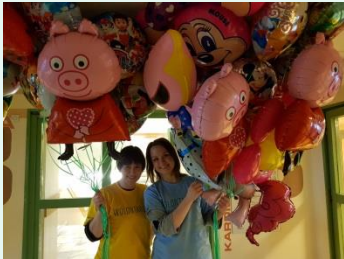
Konkurs na Projekty Wolontariackie, maj 2018