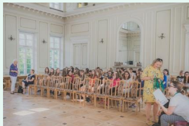
Integracyjny obóz językowy dla stypendystów, lipiec 2018 r (fot. Oskar Jarzyna).