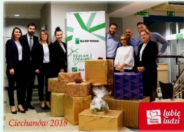
Szlachetna Paczka. grudzień 2018