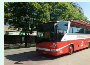
Akcja Krwinka w Banku, maj 2018