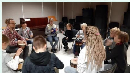
Zajęcia z zajęć Dream Up, listopad 2018 r.

Pierwsza edycja programu realizowana w latach 2015-2018 skierowana była do dzieci i młodzieży z ognisk wychowawczych Towarzystwa Przyjaciół Dzieci i Centrum Wspierania Rodzin na warszawskiej Pradze. Inicjatywa realizowana była we współpracy z Fundacją Muzyka jest dla wszystkich (operator programu, www.muzykajest.pl ). W ramach programu Fundacja organizowała zajęcia z gry na instrumentach w placówkach, których celem był rozwój muzyczny, osobisty i społeczny uczestników.