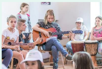
Letni Obóz Muzyczny, sierpień 2018 r.