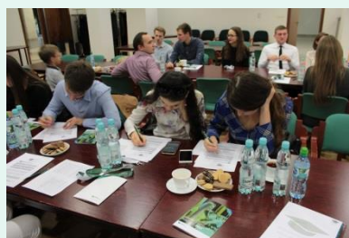
Walne Zebranie Członków Stowarzyszenia Absolwentów Programu Klasa, wrzesień 2018 r.