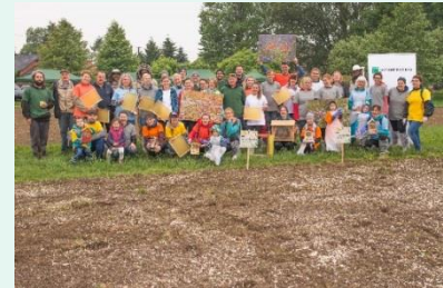
„Zalączmy” nasze miasta, maj 2018.