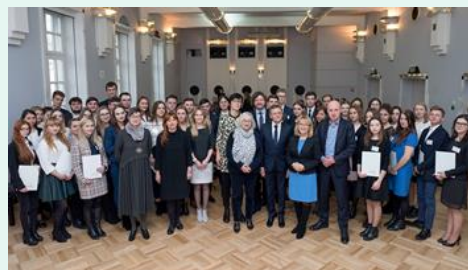
Gala programu Stypendia Pomostowe, listopad 2018 r.

Program skonstruowany został w taki sposób, aby zachęcać i motywować do dalszej edukacji najzdolniejszych uczniów planujących działać na rzecz rozwoju obszarów wiejskich. Pierwszy etap (stypendium dla laureatów OWiUR) ma charakter nagradzający i motywacyjny. Wielu stypendystów wyróżnionych na tym etapie, po zakończeniu szkoły średniej decyduje się na kontynuację nauki na specjalistycznych uczelniach wyższych, gdzie również może liczyć na wsparcie Fundacji w ramach programu Stypendia Pomostowe.