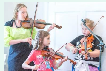
Letni Obóz Muzyczny, sierpień 2018 r.