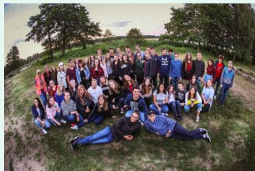
Obóz żeglarski dla stypendystów, lipiec 2018

Na koniec 2018 w programie uczestniczyło łącznie 121 uczniów .