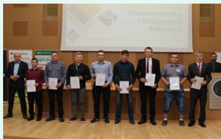
Gala finałowa OWiUR, czerwiec 2018 r.