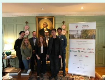
Gala finałowa konkursu Droga na Harvard, czerwiec 2018 r.

W 2018 roku w konkursie Droga na Harvard wzięło udział ponad 1200 osób. Spośród nich wyłoniono 20 laureatów i 4 laureatów nagrody głównej, którzy w październiku mieli okazję osobiście poznać Harvard.